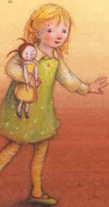
Illustration: Alessandra Roberti aus »Der Weihnachtsmann mit Brille und Glatze«, Text von Mira Lobe